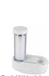
Prob Yükleyici (Opsiyonel)